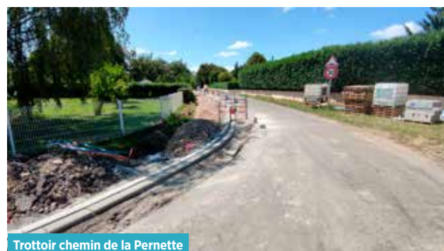
Trottoir chemin de la Pernette

Ce cheminement doux, réalisé durant l'été, permet aujourd'hui aux écoliers et aux parents accompagnateurs de se rendre à l'école en toute sécurité, il est très apprécié des riverains et permet également de canaliser la circulation.