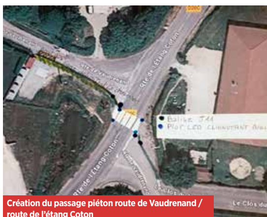
Création du passage piéton route de Vaudrenand / route de l'étang Coton