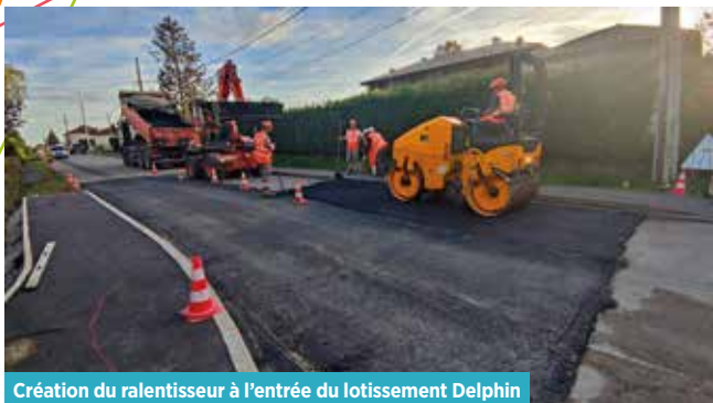
Création du ralentisseur à l'entrée du lotissement Delphin

Les vitesses excessives récurrentes, confirmées par un comptage réalisé par le département sur l'axe principal de la commune, entre, au sud les Curtallins et au nord le carrefour de Vaudrenand, ont retenu toute l'attention du conseil municipal. La sécurisation de cette route, réclamée par bon nombre de riverains, était un projet qui tenait à cœur à la Municipalité.