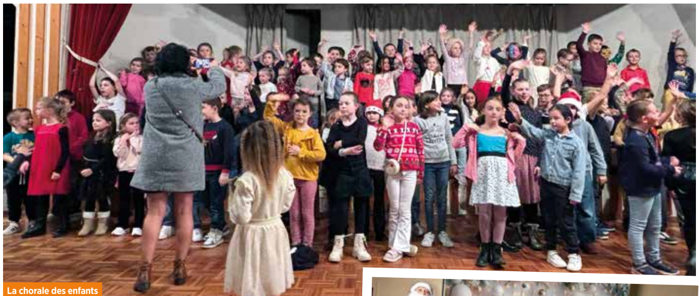
La chorale des enfants