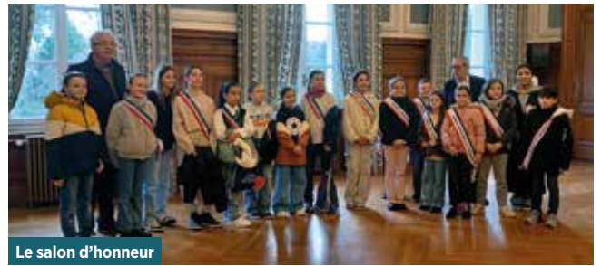
Le salon d'honneur

Les yeux brillaient, les mains vibraient d'impatience à mettre le micro en marche pour prendre la parole. Ainsi certains ont fait part de leur étonnement :