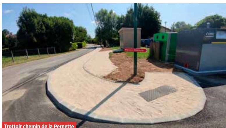
Trottoir chemin de la Pernette