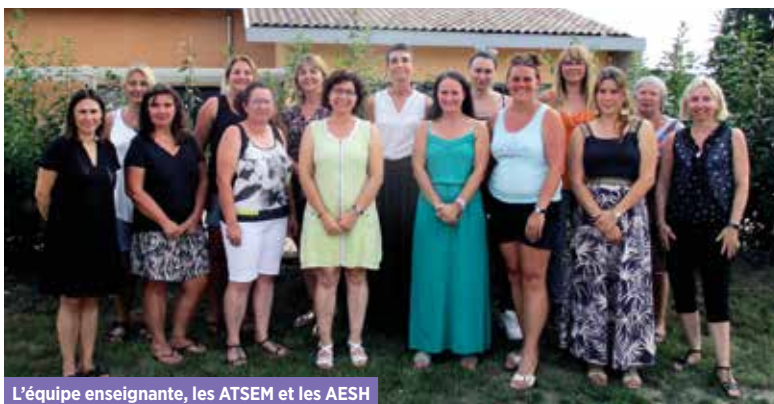
L'équipe enseignante, les ATSEM et les AESH