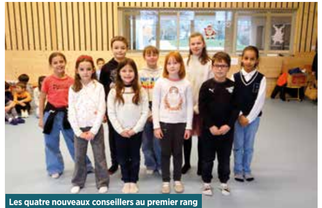
Les quatre nouveaux conseillers au premier rang

La citoyenneté se construit pas à pas, entre l'insouciance de l'enfance et la prise de conscience du monde politique ; c'est sans doute, pour les jeunes des CME de Mézeriat et Crottet, un pas de géant que ce moment a permis d'accomplir.