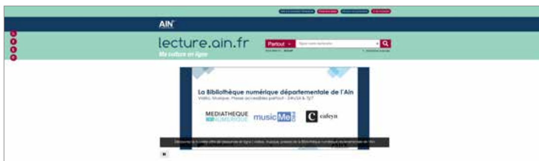
Capture d'écran du site internet : Lecture.ain.fr