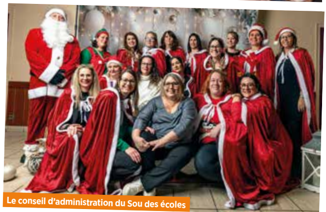
Le conseil d'administration du Sou des écoles

Le père Noël était présent tout au long de cette manifestation. Avec gentillesse, il s'est plié volontiers aux séances photos proposées par le photographe présent pour immortaliser ces moments.